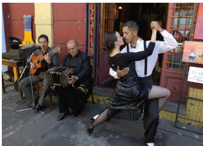
Un air de tango flotte sur le quartier de La Boca à Buenos Aires