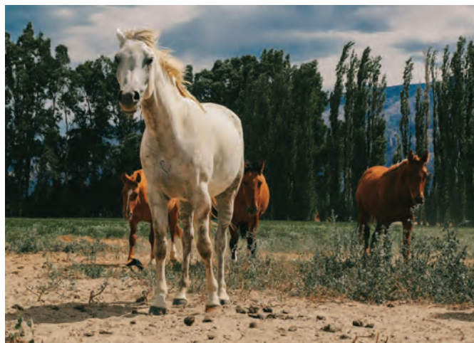
Balade à cheval