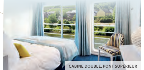
CABINE DOUBLE, PONT SUPÉRIEUR