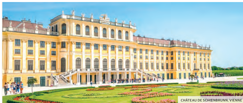
CHÂTEAU DE SCHÖNBRUNN, VIENNE

Arrivée à Vienne tôt le matin. Petit déjeuner buffet à bord. Débarquement à 9h, vol retour vers Genève (1) . Fin de nos services.